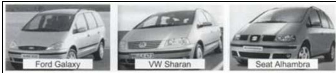
Abbildung 1: Ford Galaxy, VW Sharan und Seat Alhambra im Vergleich

„Brands have run out of juice. More and more people in the world have grown to expect great performance from products, services and experiences. And most often, we get it. Cars start first time, fries are always crisp, dishes shine.“ 1 Produkte gleichen sich aus Kundensicht in ihren technisch-funktionalen Eigenschaften immer mehr an und mutieren zu austauschbaren Massenmarken. Esch (2008, S. 12) führt hierzu ein Beispiel aus der Automobilindustrie an (vgl. Abbildung 1). 2