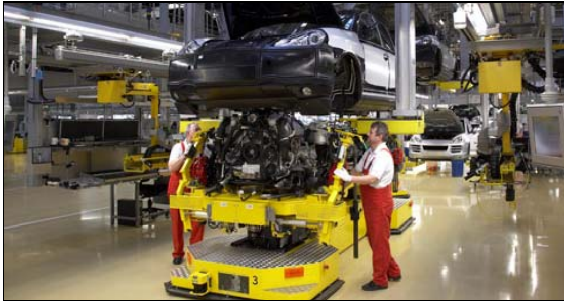
Abbildung 4: Produktion

An dieser Stelle soll dem Besucher beispielhaft verdeutlicht werden, wie Umweltschutz im Unternehmen betrieben wird. In der Wahrnehmung des Besuchers sind BL und Unternehmen eins. 96 Folglich muss das BL eine inhaltlich und individuell auf das Unternehmen zugeschnittene Struktur besitzen und authentisch wirken. 97