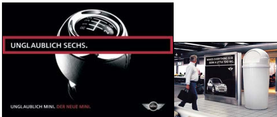
Abbildung 9: Typische Elemente der MINI CI mit Wiedererkennungswert

Auf der Angebotsseite ist das emotionale Design des MINI für das Kundenerlebnis von zentraler Bedeutung. MINI ist nach Schmitt/Mangold (2005, S. 293) „das grinsende, nette, freche Gesicht, die großen Augen, der lachende Kühlergrill, eine steil stehende A-Säule, Räder an den Ecken – wie ein Go-Kart – und ein vollkommen flaches Dach, um auch das entsprechende Fahrverhalten und damit das Go-Kart-Feeling zu erzeugen.“ Die klassische Kommunikation von MINI ist geprägt durch klare Linien, geometrische Formen, die dominierende Farbe Schwarz und gezielt gesetzte Farbakzente wie gelb, orange oder grün zur Gestaltung von Rahmen und Flächen. 130 Die Bildsprache in den klassischen TV- und Printanzeigen ist nach Kleebinder (2009, S. 127) „direkt, frech und erfrischend.“ Diese Elemente der MINI Corporate Identity erlauben eine hohe Wiedererkennbarkeit (vgl. Abbildung 9).