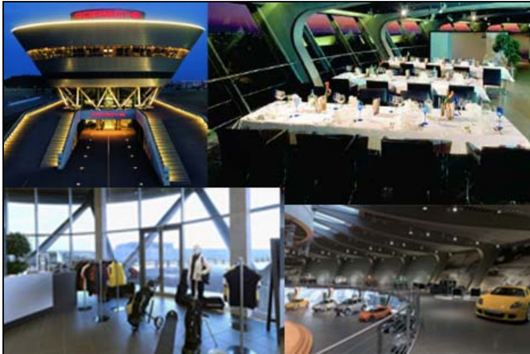
Abbildung 3: Porsche Kundenzentrum

Was Binder (2008, S. 184) als Storyline bezeichnet, lässt sich auch in der Architektur des Produktionsbereichs wieder finden. Das „konsistente Bild der Marke in der Wahrnehmung der Besucher“ 94 äußert sich auch hier. Der Boden der Werkshalle ist sauber und scheint sogar zu glänzen. In dem technisch hochwertigen Produktionsbereich kann der Cayenne oder Panamera von der „Motorenvormontage bis zum Fahrzeugfinish durch die Fertigung“ begleitet werden. Der Besucher kann von außen beobachten, wie die Ingenieure und Mechaniker mit größter Konzentration und Sorgfalt die Rennsporttechnik zusammensetzen (vgl. Abbildung 4).