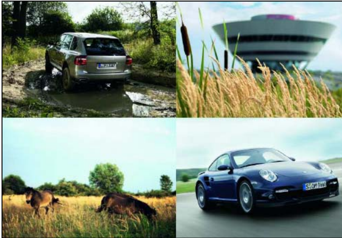
Abbildung 5: Teststrecke

Springer (2008, S. 196) konnte in ihrer Studie zur Überprüfung der Wirkungsweise des PBL zeigen, dass durch die Ansprache mehrerer Sinnesorgane eine stärkere Einstellungsveränderung zur Marke bewirkt werden kann. Zudem werden in Bereichen wie der Fahrstrecke, wo der Anteil an multisensorisch erfahrbaren Elementen zunimmt, Markeneigenschaften positiver beurteilt. 98 Dies liegt daran, dass der Kunde hierbei direkt die Marke Porsche erfahren kann und sich z. B. von Markenaussagen wie „aktiver Umweltschutz“ in der Realität überzeugen lassen kann. Allerdings ist zur Beurteilung der Kaufabsicht, der kognitiv geprägte Teil der Markeneinstellung ausschlaggebender als der affektive Teil. 99 Somit sind multisensorische Erlebnisse nicht zwingend Garant für eine stärkere Markeneinstellung.