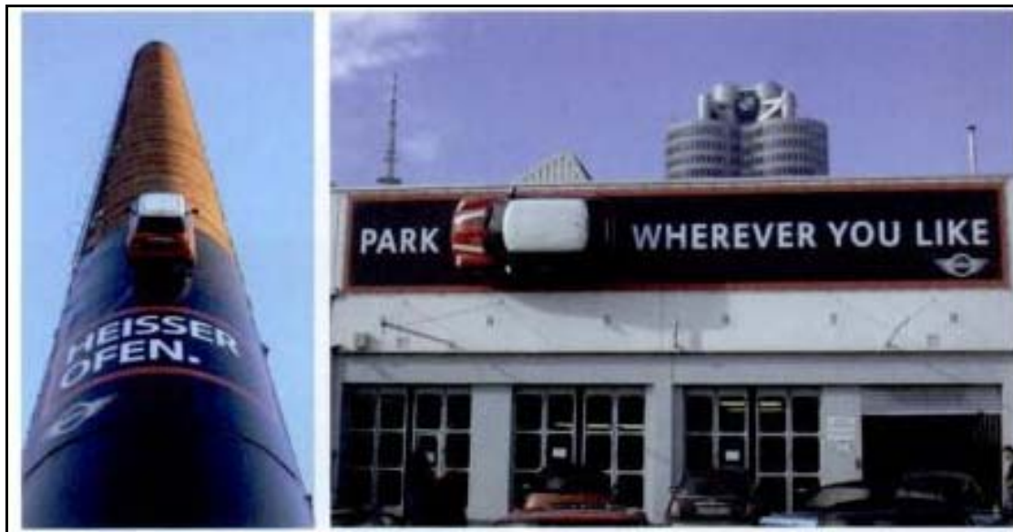
Abbildung 10: MINI Fiberglass Modell 133

Der Erfolg dieses authentischen und durchgängigen Markenerlebnisses zahlt sich schließlich aus. MINI hat es als erster Autohersteller geschafft, einen Kleinwagen international im Premiumsegment zu positionieren. Der durchschnittliche Preis eines MINI liegt laut Kleebinder (2009, S. 128) etwa ein Drittel über dem Durchschnitt im Kleinwagensegment.